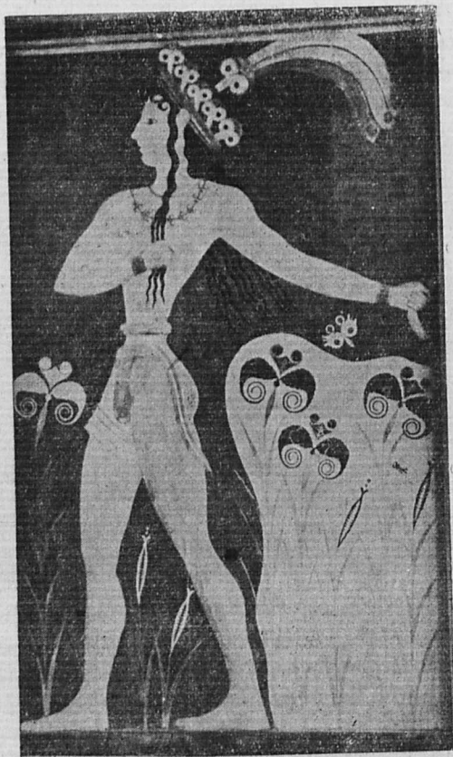
Ὁ πρίγκηψ τῆς Κνωσσοῦ

Γενικῶς εἰς τὸν τομέα τοῦτον τῆς τουριστικῆς ἐξυπηρέτησεως προσπάθεια καταβάλλεται ὅπως τὸ τελωνεῖον διέπεται ἀπὸ πνεῦμα ὑπηρεσιακόν