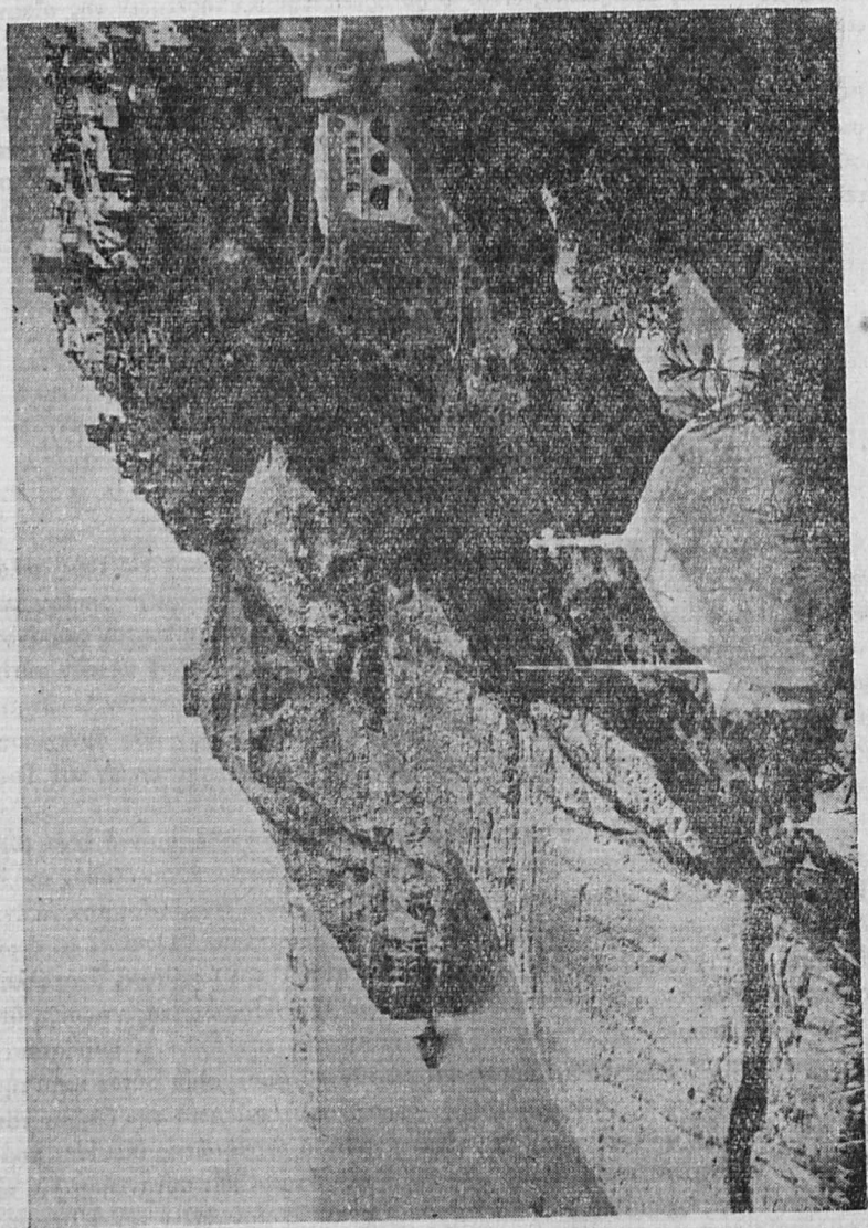
"Αποψις της Σαντορίνης