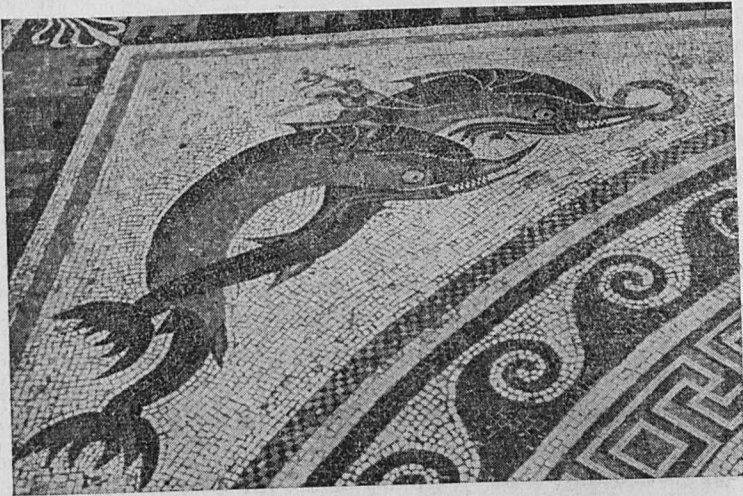
Ψηφιδωτὸν τῆς Δήλου

Τὰ ἀποτελέσματα ὑπῆρξαν ἱκανοποιητικά. Ταξιδιωταὶ, καλῆς πίστεως