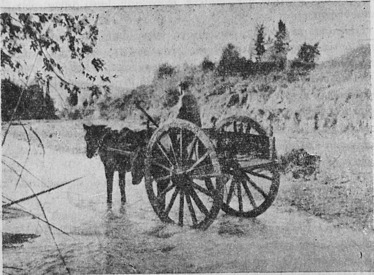
Ἀπὸ τὸν φωτογραφικὸν διαγωνισμὸν τῶν σπουδαστῶν τῆς Σχολῆς. Ὁ ποταμὸς Λάδων.

Ἐμμεση διαφήμιση, καὶ μεγάλο τουριστικὸ ἔργο κάνουν ἐπίσης τὰ σωματεῖα περιηγήσεων καὶ ἐκδρομισμοῦ μετὰ τὴν ἀξιόλογη δράση τους. Γιατὶ κατὰ τὶς ἐκδρομὰς ποὺ ὀργανώνουν στὰ χωριά οἱ φυσιολατρικὲς ὀργανώσεις τῶν μεγάλων πόλεων—ἀλλὰ καὶ ὅλοι ὅσοι κάνουν ἐκδρομὰς στὴν ὑπαιθρο—βρίσκουν τὴν εὐκαιρία νὰ κουβεντιάσουν φιλικὰ μετὰ τοὺς χωρικοὺς, νὰ τοὺς περιγράψουν τὶς ἀνάσεις ποὺ προσφέρουν στοὺς ξένους τὰ χωριά τῆς Ἑλβετίας ἢ ἄλλων χωρῶν προηγημένων τουριστικῶς ποὺ ἐπεσκέφθησαν, καὶ νὰ τοὺς παρακινήσουν—χωρὶς βέβαια νὰ τοὺς θίξουν—νὰ κάμουν κι αὐτοὶ