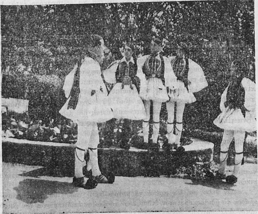
Ὅμας εὐσταλῶν εὐζώνων

Ἡ ἐπαναφορὰ τοῦ ἄρθρου 16 τοῦ Νόμου 4377 τοῦ 1929, διὰ τοῦ